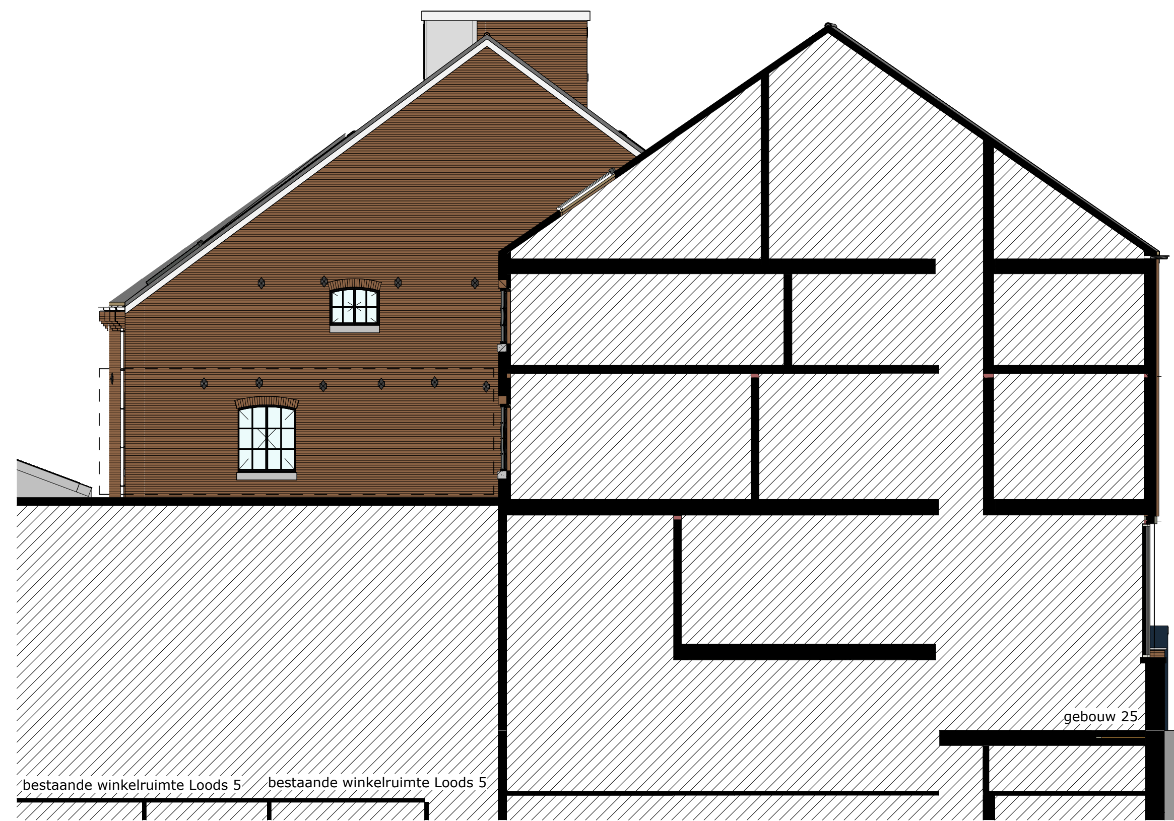
Linker zijgevel 1:100