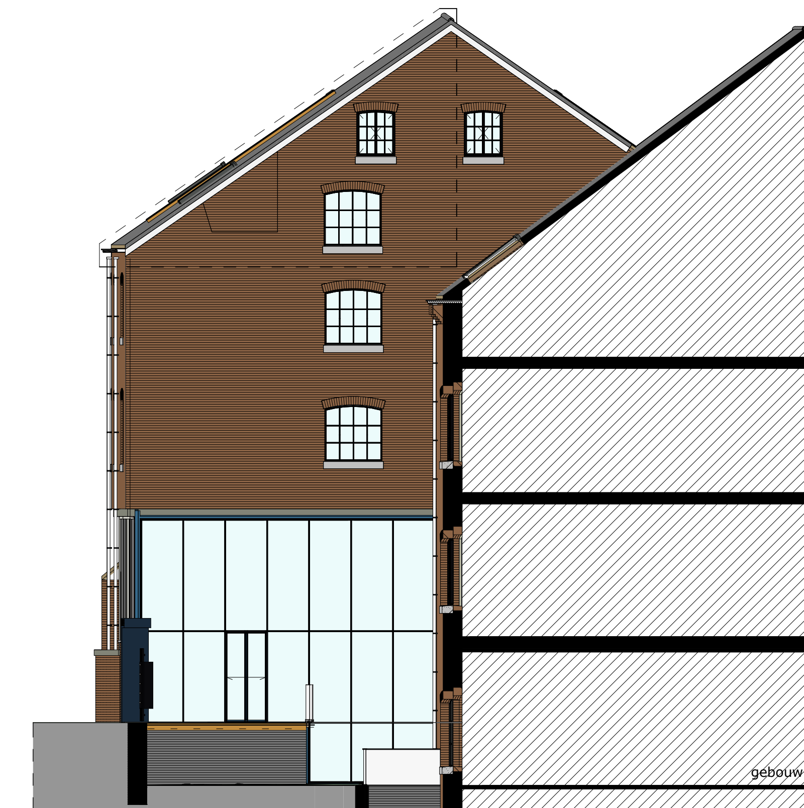
Rechter zijgevel 1:100