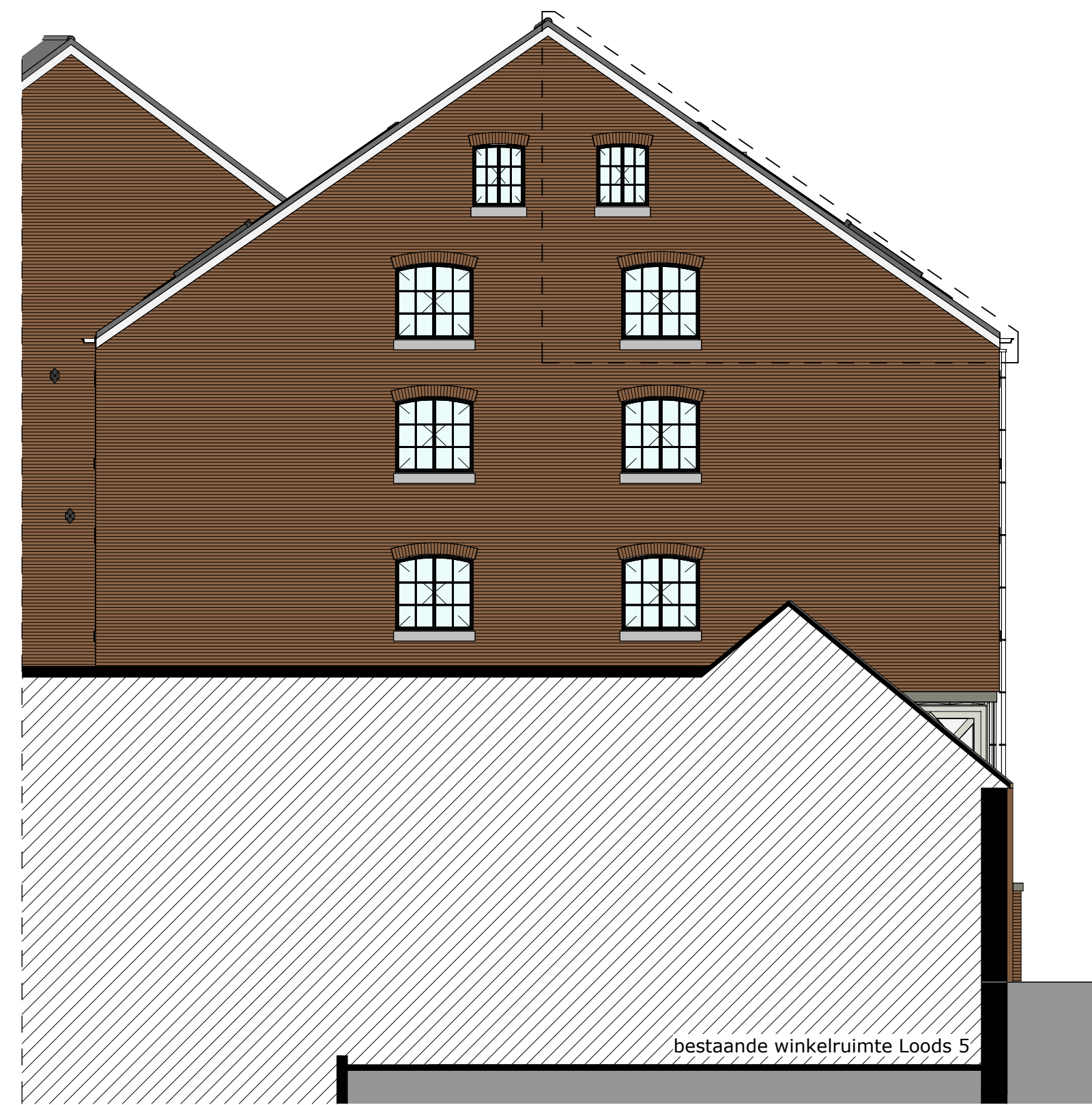
Linker zijgevel 1:100