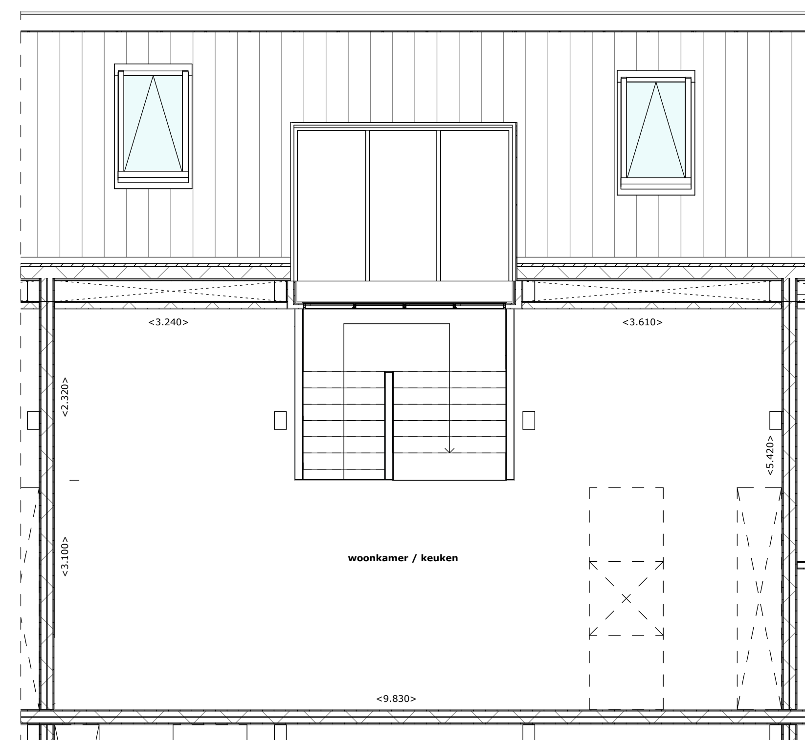
Plattegrond verdieping 04 1:50